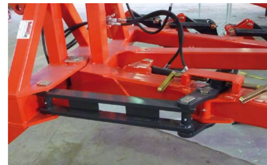
Réglage du devers hydraulique (en option)