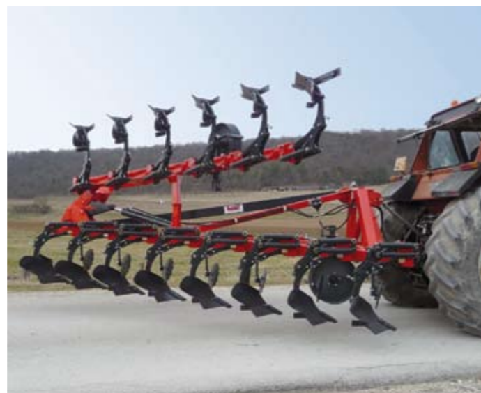
Gardez l'avantage du porté tout en ayant une bonne largeur de travail – Position transport, largeur inférieure à 3 m