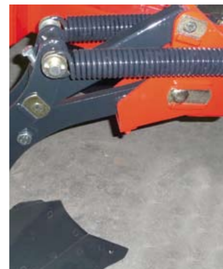
Sécurité non-stop mécanique. Puissance de déclenchement maxi 1 800 kg.