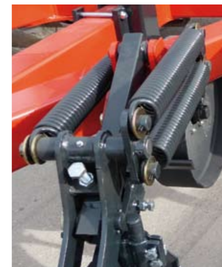
En option : sécurité non-stop mécanique renforcée. Puissance de déclenchement maxi 2 200 kg.