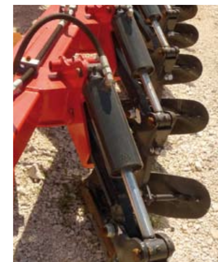
En option : sécurité non-stop hydraulique. Puissance de déclenchement réglable.