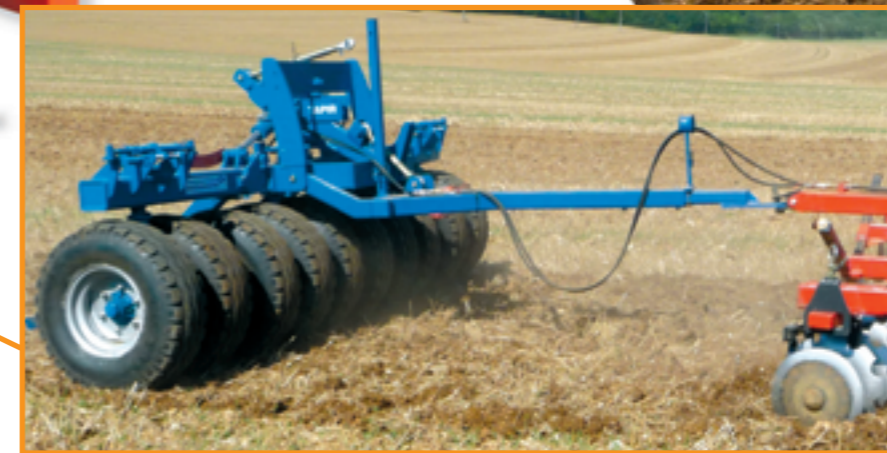
OPTION : Reifen Packer