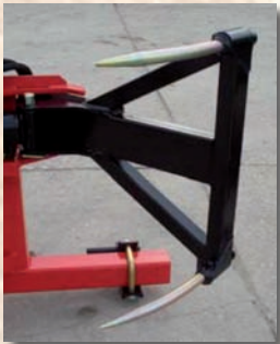
Standartzange (réf. A811)