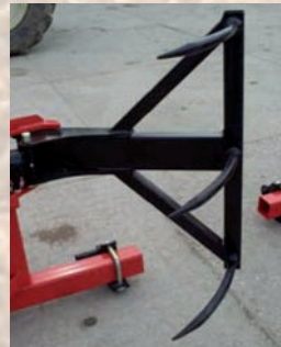
Zange für Ballen \varnothing > 1,60\text{ m} (réf. A809)