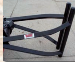
Zange für Folienballen : \varnothing < 1,30\text{ m} (réf. 808-1) 1,30\text{ m} < \varnothing < 1,60\text{ m} (réf. 808-2)