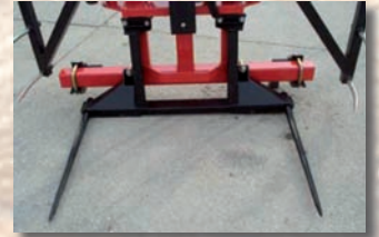
Zusatzrahmen mit 2 Spitzen (réf. CHPDB)