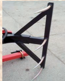
Zange für Quaderballen (réf. A810)