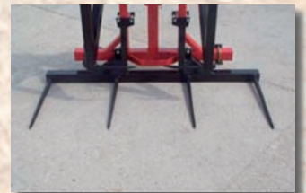
Zusatzrahmen mit 4 Spitzen (réf. CHPBL)