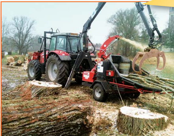
Anbau im Dreipunkt am Schlepper mit hydraulischen Antrieb