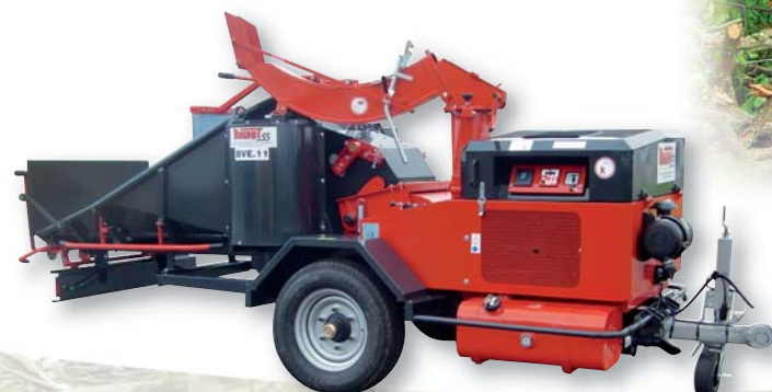
Abbildung: 80 PS Dieselmotor Einachser PTAC 3 T