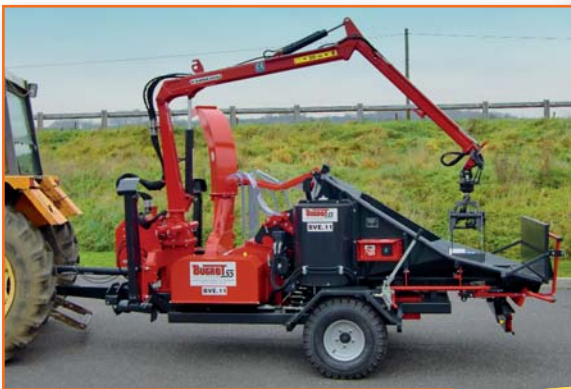
Anbau auf Schredder