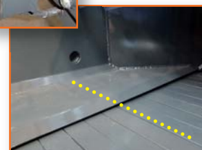
Impulslinie im Trichter