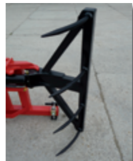
Griffes pour balles rectangulaires (réf. A810C)