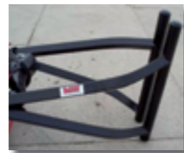
Pinces pour balles enrubannées : \text{Ø} < 1,30 \text{ m} (A808 T1) 1,30 \text{ m} < \text{Ø} < 1,60 \text{ m} (A808 T2)