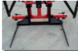
Châssis porte dents baïonnettes (réf. CHPDB2)