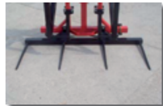
Châssis porte dents baïonnettes (réf. CHPDB4)

GRIFBAL / T1800 / ROTOLEV 1600 / ROTOLEV 2500 S