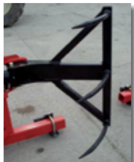
Griffes pour balles \text{Ø} > 1,60 \text{ m} (réf. A809C)