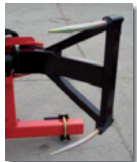
Griffes standards (réf. A811C)