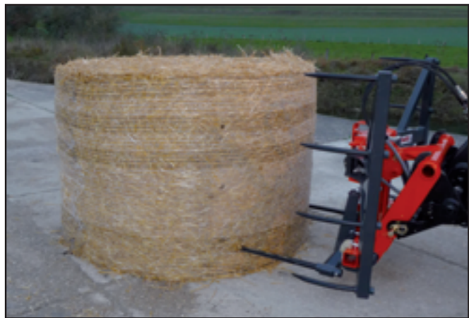
GRIFBAL 4 dents avec porte baïonnettes 2 dents (en option)