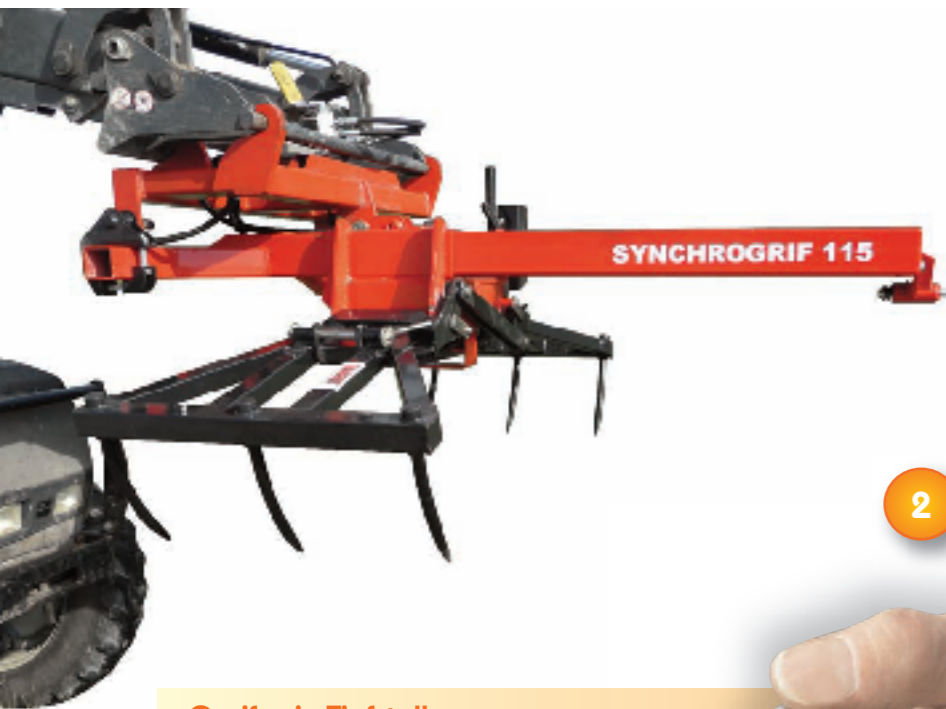
Greifer in Tiefstellung