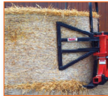
A809 syn (3 Zinken) für Rundballen Ø > 1,60 m