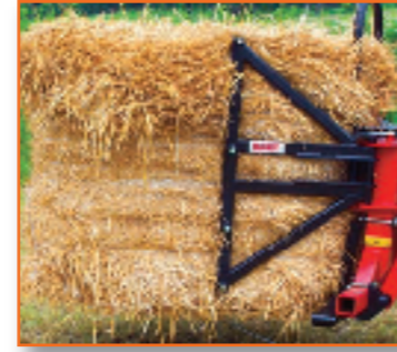
A810 syn (4 Zinken) für Rund- und Viereckballen