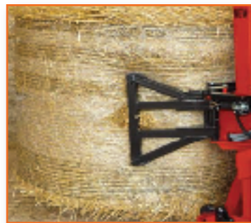
A811 syn (2 Zinken) für Rundballen