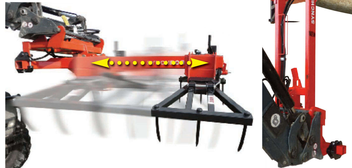
Bewegungen des Greifers

Hydraulisches öffnen der Arme von Arbeitsplatz und Elektro- Verriegelung wenn der Mast des SYNCHROGRIF 115 in horizontal Stellung ist (unmöglich über 20° nach oben).